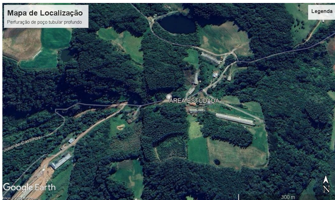
Figura 01: Localização do ponto sugerido para a perfuração do tubular.

A partir do estudo realizado, foi definido que a perfuração e instalação de 1 (m) poço tubular profundo e demais materiais está prevista para ser executada às margens da estrada geral, Linha Garibaldi, município de Imigrante/RS, geograficamente definido pela Lat.: 29°18'16.98"S /Long. 51°45'52.65"O (Figuras 01 e 02 e Foto 01).